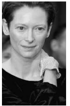
Tilda Swinton

Szereplők: Liam Neeson, Tilda Swinton, Ben Barnes