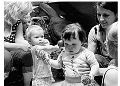
Szemünk fénye, a gyerek

Az Egészségügyi Világszervezet ajánlása szerint a csecsemőket fél éves korukig kizárólag anyatejvel volna szabad táplálni. Az anyatejes táplálás az allergia megelőzésének legfontosabb eszköze, ezért is nagyon fontos, hogy az édesanyák minél tovább szoptassanak. A szoptatás, amellyel, hogy a legegészségesebb táplálás, megalapozza az anya és a gyermek kapcsolatának kialakulását is. Az anyatej mind mennyiségében, mind összetételében alkalmazkodik a csecsemő változó szükségleteihez. Mindent és mindenből annyit tartalmaz, amennyire a kisbabának szüksége van.