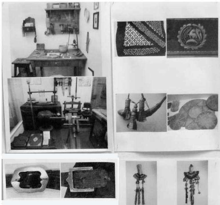
Sok szép dísz- és használati tárgy a kiállításon

Hasonló a véleménye Terényi Gyöngynek, aki nyolcadik éve segíti, tanítja a táborlakókat, vezeti a gyakorlati munkát. Neki megélhetése a „bőrözés”, van egy réteg, mely keresi a mun-