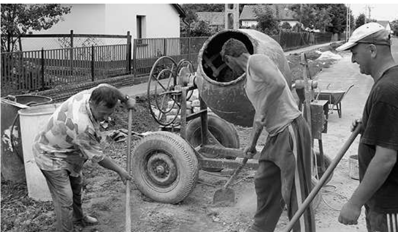
Kalákában dolgoztak a Tolbuhin utcán