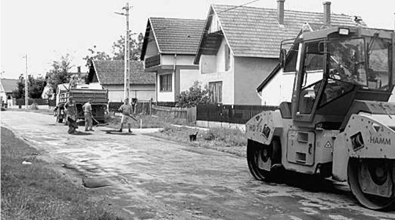
Sok utcában megfordultak már ezek a gépek

Képriportunk a munkálatok néhány mozzanatát mutatja be.