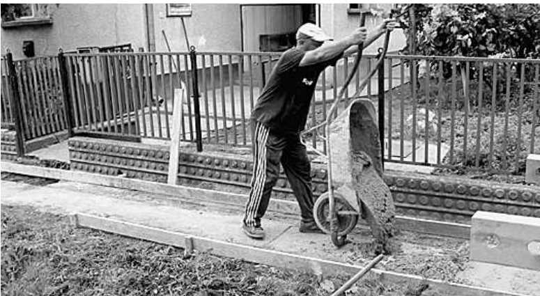
Elkél a kézierő is a járdaépítésnél