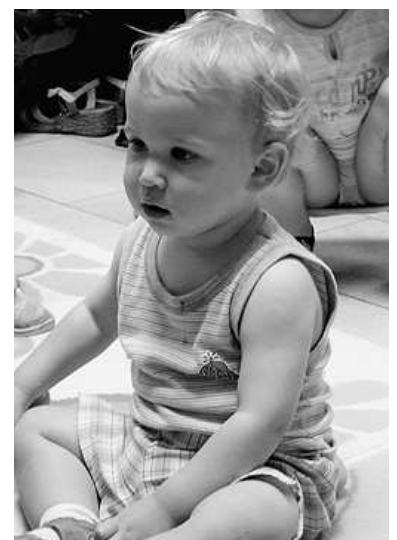
A jövőnek neveljük