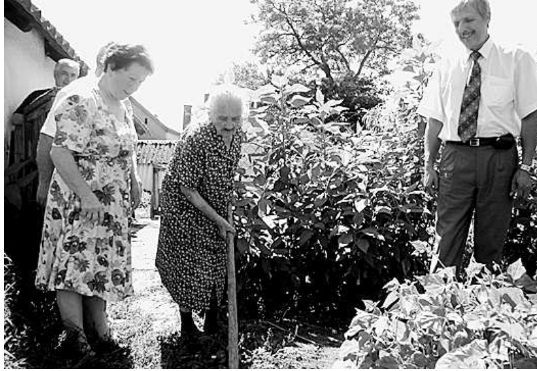
Így szoktam kapálni