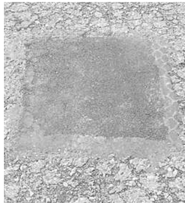
Egy kátyúval kevesebb