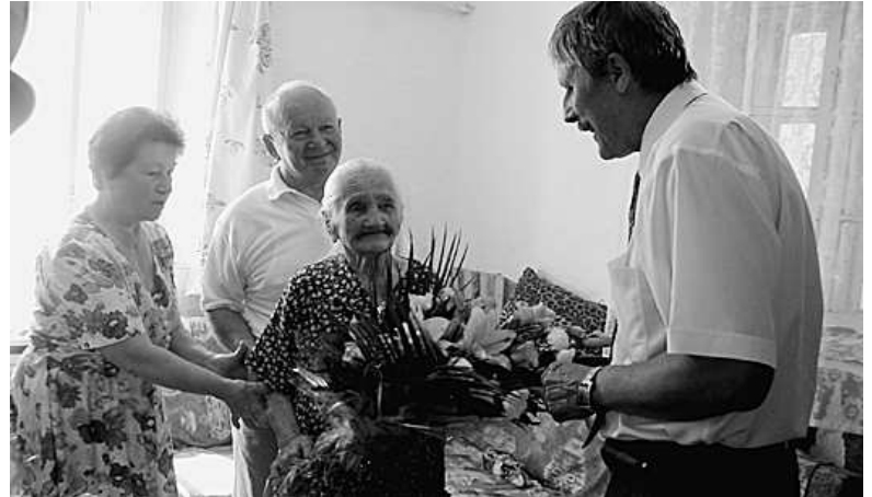
A megye legidősebb lakosa

Még az Osztrák-Magyar Monarchia idején, 1904. július 29-én született özv. Hornyák Józsefné Hajdú-Bihar megye legidősebb asszonya, aki hét rendszerváltozást, két világháborút is túlélt. A