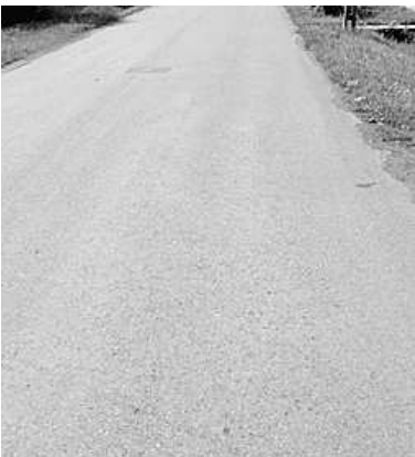
Ilyen sima útról álmodoznak a közlekedők