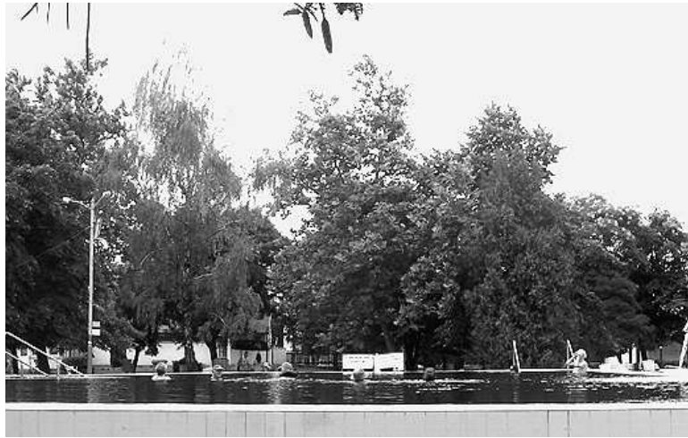
Hiányzik a gyermekmedence; a vendégek kétharmada nem helybéli

Tíz év alatt sem jutottak azonban az arra illetékesek a strand gyerekmedencéjéig illetően. Pontosabban arra, hogy a tisztiorvosi szolgálat betiltotta a medencét, mégpedig olyan fenyegetésség-