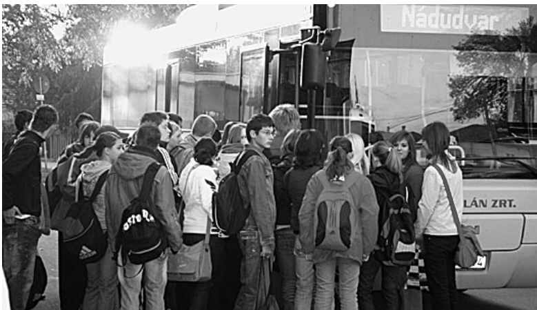
Reggelente sok az utazó diák