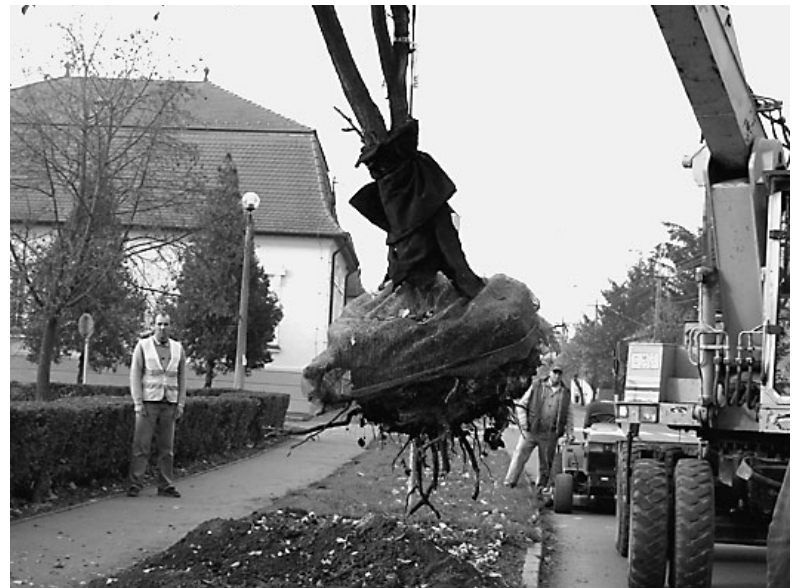
Az egészséges fákat a II-es óvoda udvarára ültették

ünneplő házaspárokat. Az alkalomra az Alapfokú Művészeti Iskola tanárai és növendékei készültek meglepetésműsorral, majd Márkus Ica és Bartha András nótáénekesek kedveskedtek a székporúaknak, és minden érdeklődőnek. Az ünnepséget zenés vacsora zárta.