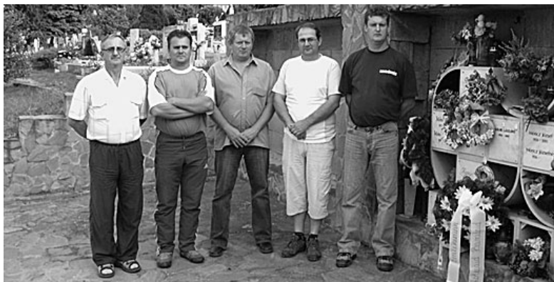
Néhányan a résztvevők közül