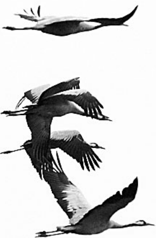
Szállnak a darvak, avagy a magyar puszták címermadarai