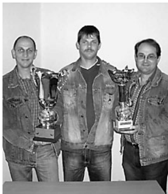
A Szent István-kupa nádudvari győztesei