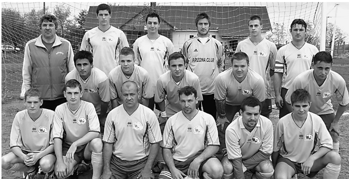
Az 5. helyen telelnek a focisták

Ötödik helyen zárták a focisták a kétszoros megyei II. osztályú bajnokság Északi csoportjának őszi küzdelmeit, amelyben tizenkét együttes vett részt.