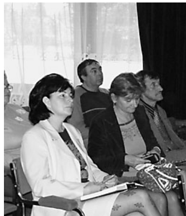
A tájékoztató közönsége