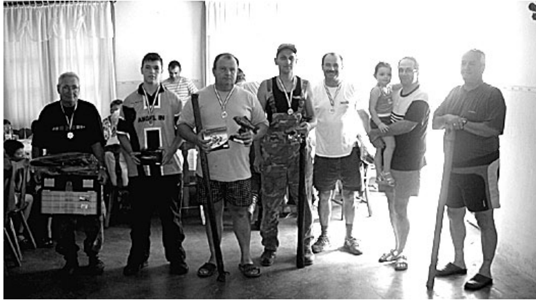
A Hortobágy folyón horgásztak

A Nádudvari Sporthorgász Egyesület augusztus 10-én (vasárnap) - harmadik alkalommal - helyi, zártkörű folyóvízi horgász (halfogó) versenyt rendezett, melyre 40 versenyző szándékozó horgász érkezett és dobta be a készségét. A Hortobágy folyó azon szakaszán, melyre területi engedéllyel rendelkezünk, a nevezők számának megfelelő horgászhelyek lettek kialakítva, számmal megjelölve, melyet a verseny kezdete előtt sorshúzással sorsoltunk ki.