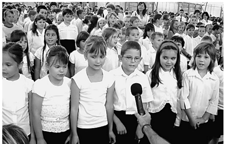
Elöl az első osztályosok