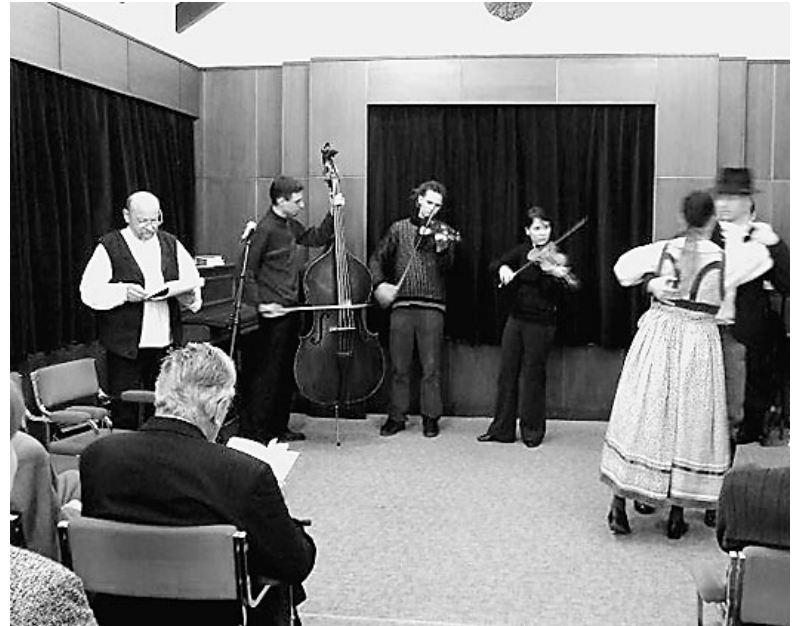
Képünkön a fellépők