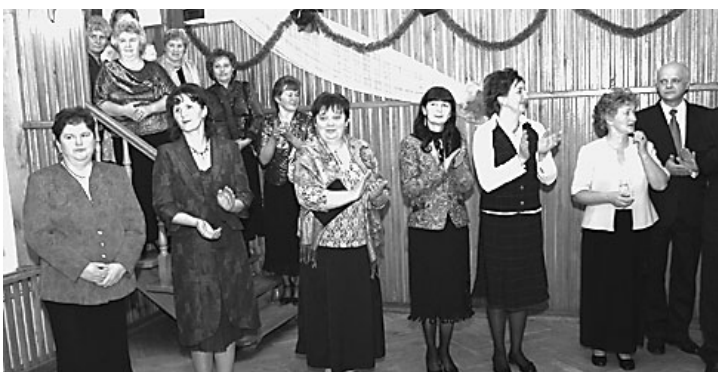
Lengyel-magyar nőbarátság

Lengyel testvérvárosunk nőgyulete meghívására járt városunk delegációja január végén Urzedowban.