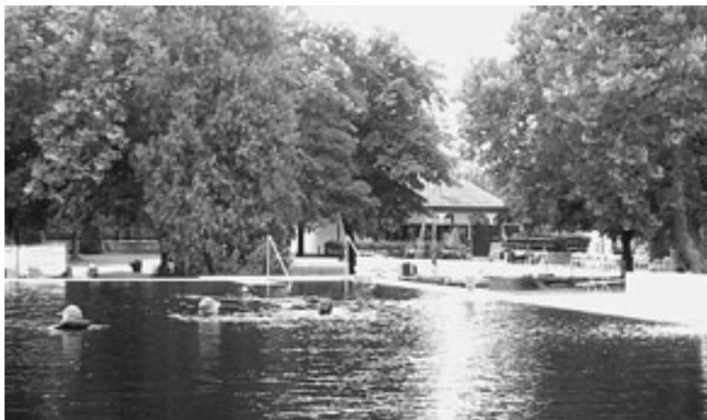
Nyugi a strandon – nincs tömeg, kevés a vendég