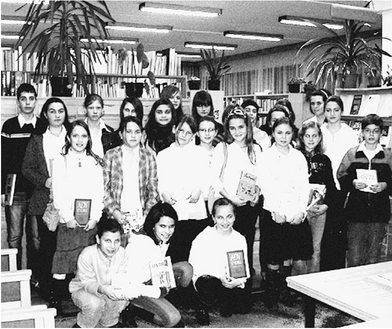
Huszonnégyen versenyeztek

Huszonnégy felső tagozatos diák két kategóriában mérte össze tudását a városi Kazinczy-versenyen február 4-én. Az iskolai forduló legsikeresebbjei próbálták elnyerni a zsűri tetszését, hogy képviselhessék Nádudvart az országos versenyen, amit a Dunától keletre eső megyék tanulójának az idén Kisújszálláson rendeznek meg április 3. és 5. között.