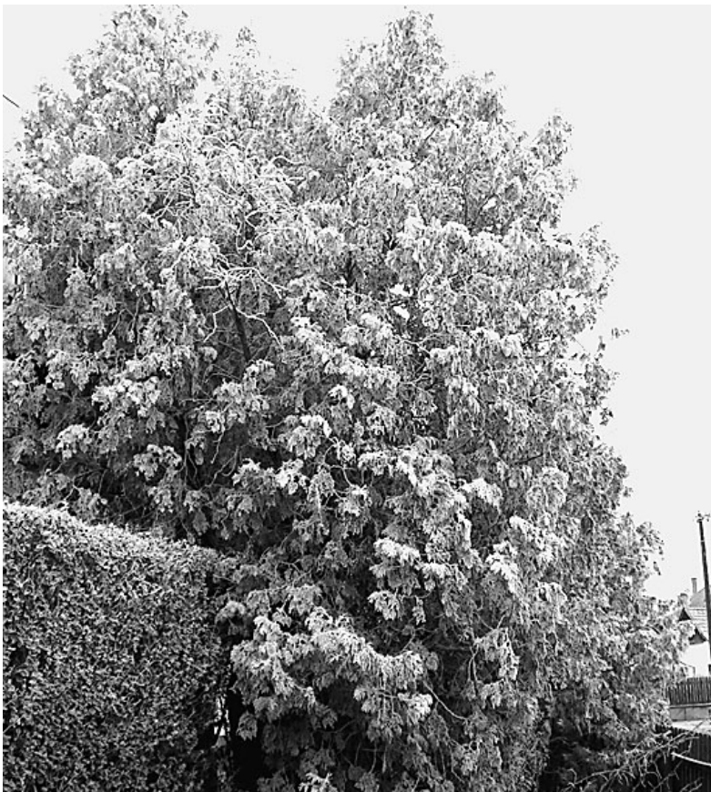
Deret, zúzmarát, havat hozott az új év