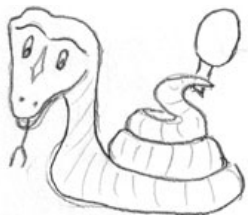
A rendezvény logója lehetne