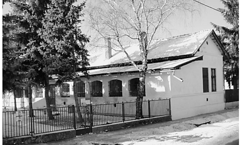
Már évtizedek óta nem fogadja a vendégeket

– Egy idős ember belefutott. Minden nap járt, gyógyította magát a meleg vízzel. Egyszer csak láttam, hogy ömlött a