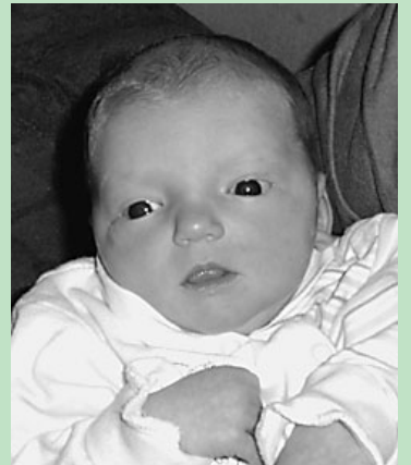
Két fiú után érkezett a kislány

A kicsi lány a júniusban negyedik évét betöltendő Lóránt és a három éves Gergő után érkezett a Tarcsi családba.