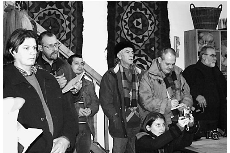
A közelmúltban erdélyi újságírók három napot töltöttek városunkban és régióinkban – tudósításunk a nyolcadik oldalon