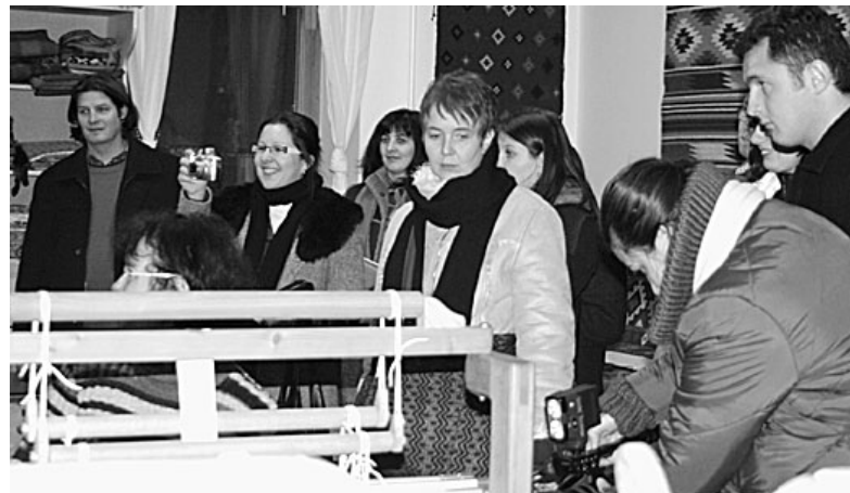
Az erdélyi újságírók a szakiskola szövőműhelyében