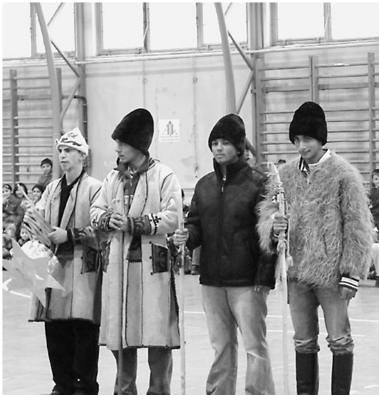
A diákok szívesen ébresztgették a népi hagyományokat