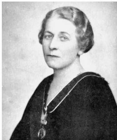
Tormay Cécile írónő

Középnemesi családba született. Édesapja Tormay Béla mezőgazdasági szaktekintély, az MTA tagja, államtitkár. Édesanyja Barkassy Hermin. Iskola tanulmányai magántanulóként végezte. Német, olasz, francia, angol és latin nyelven eredetiben tanulmányozta a világirodalmat. 1900 és 1914 közötti külföldi utazásai nemzetközi ismertséget elősegítették. Első könyvei az Apródszerlem (1899) című novelláskötet és az Apró bűnök (1905) elbeszéléskötet. Első sikeres regénye az Emberek a kövek közt (1911) a kisemberek életét ábrázolta. Megjelent angol, német, olasz, holland, finn, észt nyelven is. A Régi ház (1914) családregény, a biedermeier kori Pest ábrázolása. Ezzel a regényével a Magyar Tudományos Akadémia irodalmi díját nyerte el. Ez a könyv is számos nyelven megjelent, az USA-ban is kiadták. Bujdosó könyv (1921–22) naplószerű regényéből az 1918. október 31-től 1919. augusztus 8-ig terjedő időszakról (őszirózás forradalom, Tanácsköztársaság) megkérdőjelezhető ismeretek szerezhetők. Német, angol és francia nyelven is megjelene világsikert aratott. Klebersberg Kunó felkérésére latinból magyarra fordítja középkori legendáinkat Magyar Legendárium (1935) címen. Úti élmé-