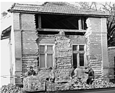
A Településfejlesztési és Városgazdálkodási Kft. munkatársai január elején elkezdték a régi bölcsőde bontását

Mozgáskorlátozottak Egyesületének Nádudvari Csoportja