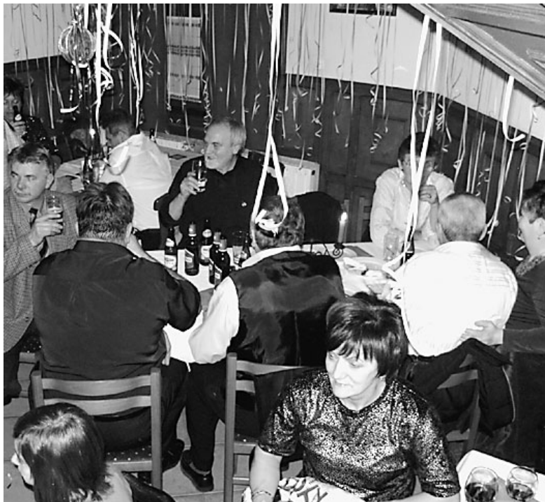
Mindenki az éjfélét várja