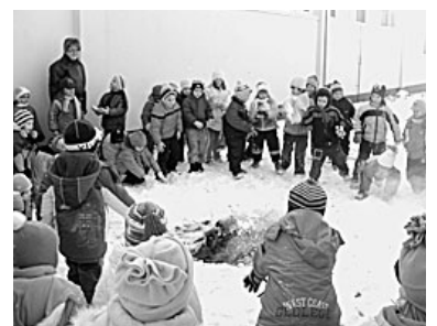
Városunkban is hagyomány