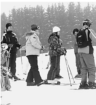
Kóstoló a téli sportból