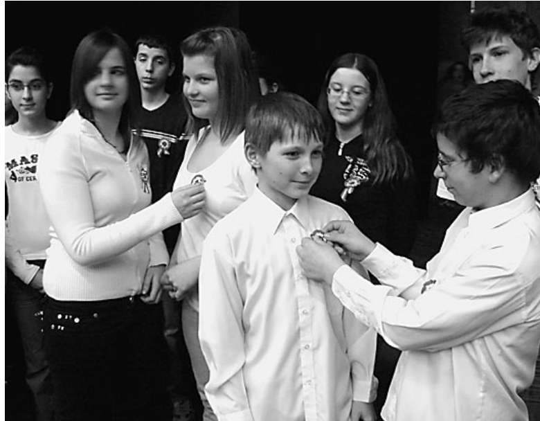
Képünkön a műsort próbáló diákok egy csoportja

Emlékezni, ünnepelni sokféleképpen lehet. Némán, szívük felett egy apró kóráddal emlékeztek a múlt egy dicső fejezetére az általános iskola tanulói.