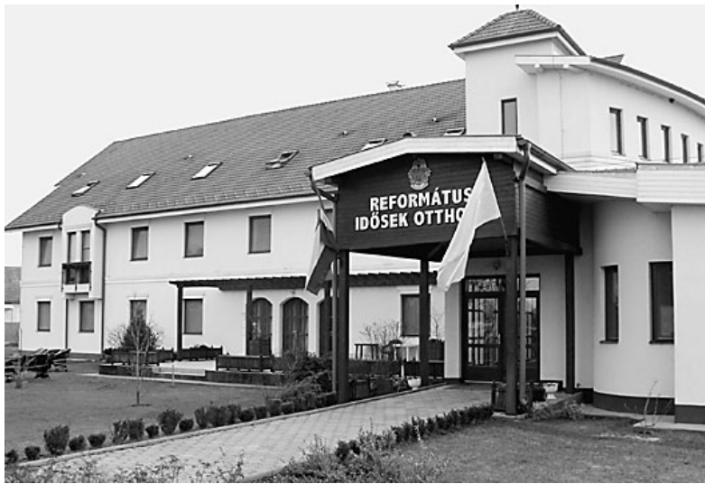
Az otthon új, impozáns épülete

A Nádudvari Református Egyház-község Jézusnak a szeretetről szóló parancsát vette komolyan, amikor elhatározta: felépít egy a 21. század igényeinek megfelelő idősek otthonát, ahol a bentlakók e szónak mindkét elemét valóságosan megtapasztalhatják, mert idős korukban szeretetet, megbecsülést, egyszersmind otthont is kapnak. Mindkettő valódi érték a mai világban.