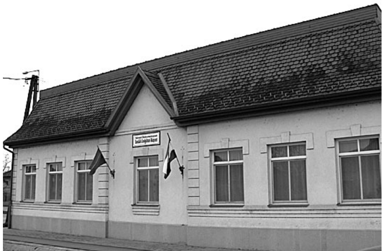
Folyamatosan gazdagodott az intézmény

Az intézmény dolgozói Van Gogh gondolatát tartják szemük előtt amikor a munkájukat végzik: „Minél tovább gondolkodom, annál inkább érzem, hogy nincs semmi, amiben nagyobb művészet lenne, mint szeretni az embereket és segíteni rajtuk.”