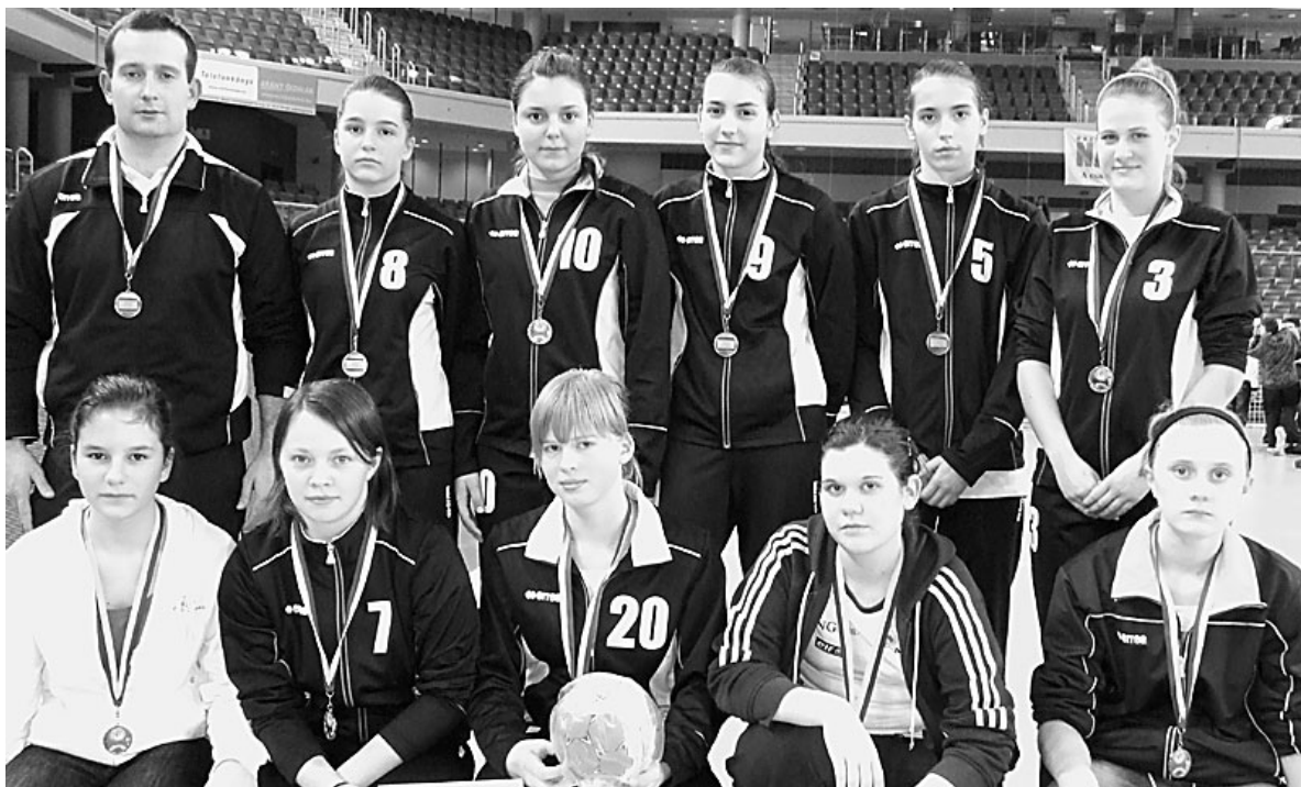
A lányok bronzéremnek örülhettek

Szép sikereket értek el a II. Főnix-kupa utánpótlás kézilabda tornán városunk fiú és leány csapatai. A Debrecenben megrendezett, összesen 99 csapatot felvonultató nemzetközi viadalon hazánk szinte minden régiójából érkeztek csapatok, köztük a legjelentősebb utánpótlás nevelő egyesületekből. Így itt volt a Fradi, a Szeged, a Vasas, a Győr, a Szekszárd, a Szombathely, a Békéscsaba, a Gyöngyös, az Eger, a Nyíregyháza utánpótlásárdái mellett természetesen megyénk számos együttese is. Így a rendező Debreceni SC-SI mellett Debrecenből a DEAC, a DVSC, míg vidékről a Balmazújváros, a Hajdúnánás, a Berettyóújfalu, a Hajdúböszörmény, no és a Nádudvar is több csapattal. De voltak itt résztvevők Szlovákiából és Romániából is.