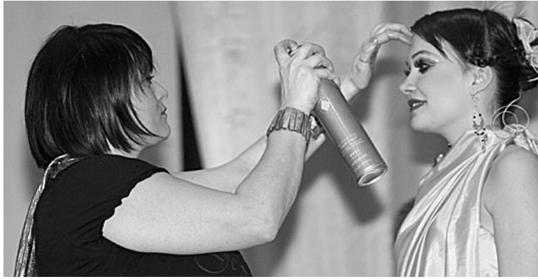
Munkában a mesterfodrász.