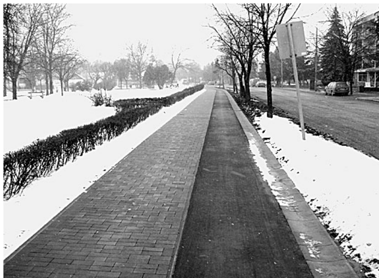
Az emberek örülnek az elkészült útszakasznak