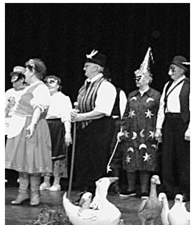
Nyugdíjasaink is vidám búcsút vettek a téltől