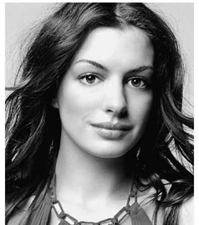
Anne Hathaway

Színes, amerikai romantikus vígjáték. Szereplők: Anne Hathaway, Kate Hudson, Candice Bergen (Korhatár: 12 év alatt szülői felügyelet mellett!)