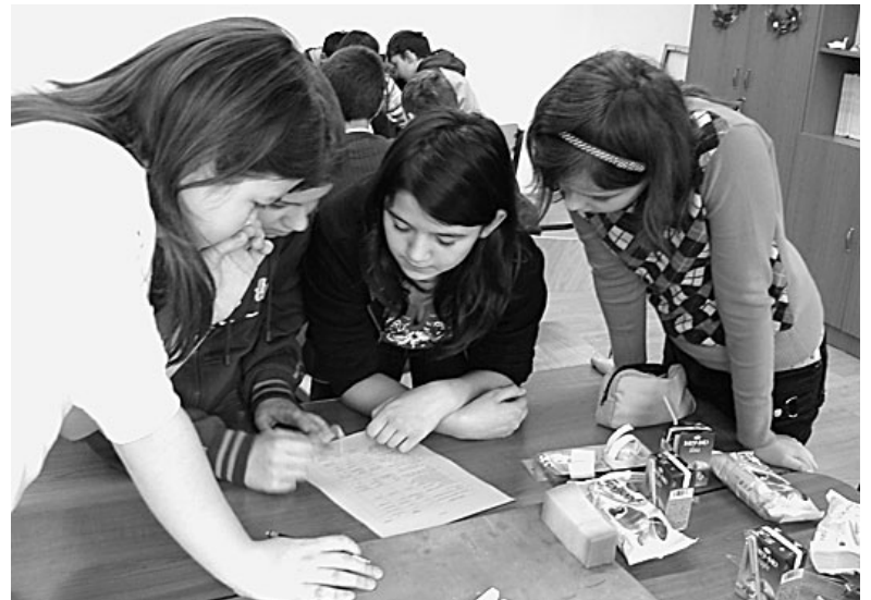
Töprengő gyerekek: mi lehet a megoldás?