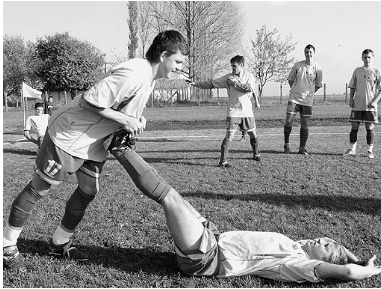
Az intenzív bemelegítés sem segített az Egyek ellen

Rendkívül hullámzóan szerepeltek a focisták a legutóbb lejátszott mérkőzéseiken. A négy fellépésükön, a megszerzhető 12 pontból csupán 4 pontot sikerült begyűjteniük. De ennél is kellemetlenebb meglepetést jelentett, hogy a két hazai meccset egyaránt elbukta a társaság. Sorrendben haladva elsőként a 9. fordulón Sárádon 1–1-es első játékrészt követően a jobb második félidei játékkal sima, 3–1 arányú győzelmet aratott csapatunk. Ezt követően egy vérbeli hazai rangadó következett a Vámospércs ellen, ám messze elmaradtak a fiúk a korábbi hetekben nyújtott jó teljesítményüktől. Így a vendégek 1–0-as első félidei vezetést követően el is vették mind a három pontot. A 11. fordulón Hajdúdorogon nyílt lehetőség a javításra, ám egy „őrült” meccsen végül örülhettünk a döntetlennek. A 80. percben még a hazaiak vezettek 1–0-ra, onnan 2–1 lett ide, majd ismét fordítva 3–2-es előnyhöz jutottak a dorogiak. De még nem volt vége, hiszen a 92. percben sikerült az egyenlítés, így a vége 3–3-as döntetlen lett, miközben hét sárgalapot is kiosztott a „spori”. A 12. forduló újabb hazai fellépést hozott, győzelmi eséllyel. Az ellenfél a középmezőnyhöz tartozó Egyek volt, ám a két csapat közötti különbség az ered-