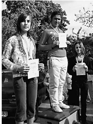
Idén sem maradhatott el az október 23. tiszteletére megrendezett „kegyeleti futás”. A versenyző gyerekeket az időjárás is segítette. Az évfolyamonként leggyorsabbak fényes érmmel a nyakukban térhettek haza