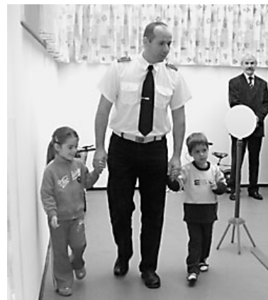
Nem elég korán kezdeni