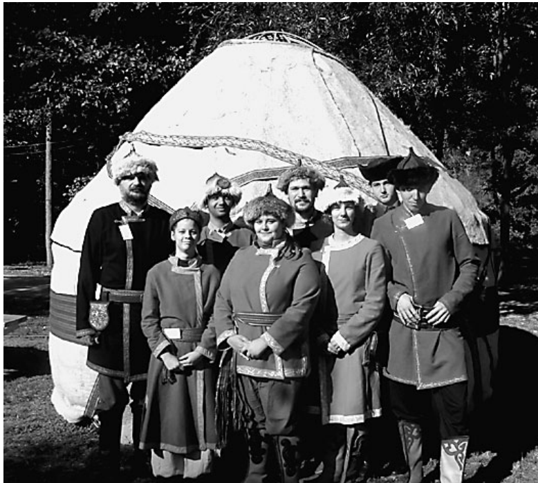
A nádudvari „különítmény” a nemezsátor előtt

tól a következő hét vasárnap esti zárásáig minden nap tartogatott meglepetést a résztvevőknek. Jó volt látni, milyen fontos és élő a múlt felfedezése. A diákok beleélhették magukat a régészek szerepébe, amikor ezernyi összetört cseréptöredékből válogatták az összetartozókat. A helyben bányászott vasércből olvasztottak vasat kísérleti régészek segítségével, öntöttek bronzot, és mindenki számára kiderült, nem könnyű tüzet gyújtani a helyben található kova és az itt kovacsolt acél segítségével. Meg is fogalmazódott a gondolat: sokat kell még fejlődünk, hogy elér-