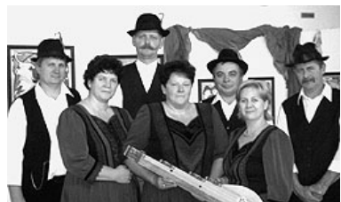
A Kéknefelejcs „hetesfogata”

A Kéknefelejcs citerazenekar két-évente szakmai minősítésen vesz részt. Szépen végigjárta a térségi, majd pedig az országos szinten való megmérettetéseket. A magas fokú szakmai vezetés, a rendszeres próbák, a népzenei táborban tanultak mindig hozzájárulnak a maguk gyümölcset, így történt ez most is. A zenekar már 2005-ben illetve 2007-ben is Arany Páva-díjat kapott. 2009-ben Egerben Fesztiválnagydíjat, most pedig az országos minősítésen a legmagasabb szakmai elismerést, ismét az Arany Páva-díjat nyerte el, immár a harmadikat. (Következő megmérettetésük egy újabb CD készítése lesz).