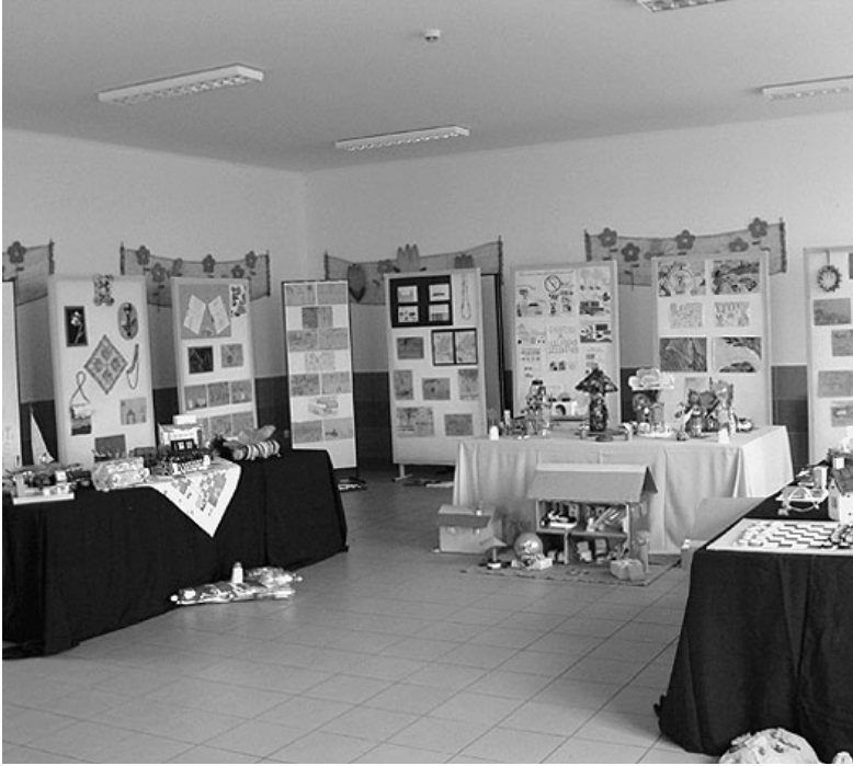
Tárgyak hulladékból

lás, szakiskolák és civil szervezetek 4 fős csapatai plakátokat és újrahasznosítható anyagokból származó tárgyakat készítettek nevezési beadványként. A pályamunkák az iskola második emeleti zsbongójában berendezett kiállításon tekinthetők meg november végéig.