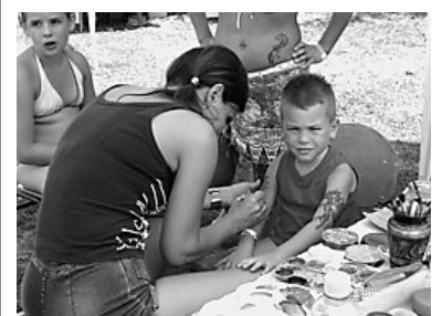
Nem tetoválás: testfestés