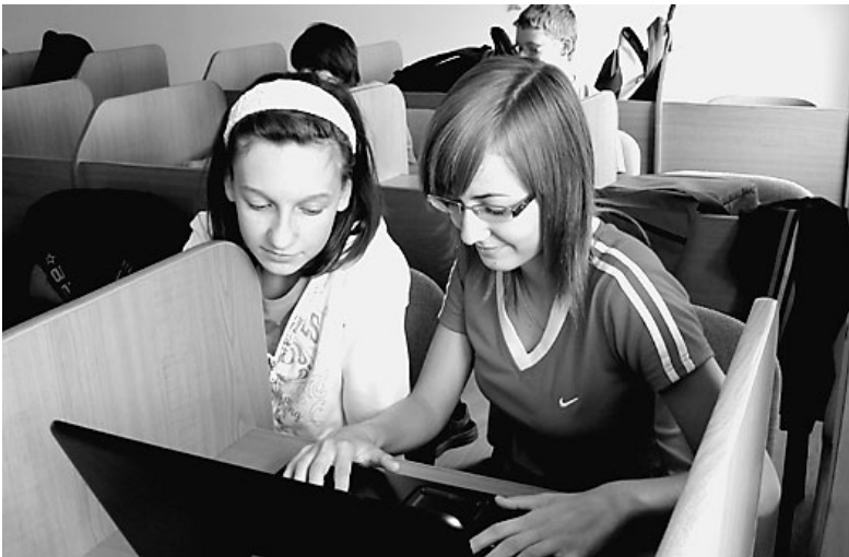
Új hordozható számítógépekkel bővült az angol nyelvi labor. A XXI. századi eszközök a beszédkészség, kommunikációs képességek fejlesztésében segítik a tanulókat