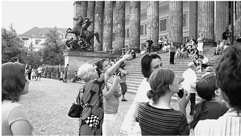
Bőven volt látnivaló a német fővárosban