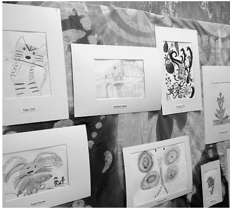
Az iskola diákjainak kiállítása a művelődési központban

Negyvenöt éves múltra tekint vissza településünkön az alapfokú művészeti oktatás. A hajdani püspökladányi fiókintézmény majd az önálló Zeneiskola és a 1999-es ÁMK-ba történő integrálást követően ma közel 300 növendék tanul iskolánkban. A paletta elég széles: a tradicionális nádudvari népi fazekasság alapjainak elsajátításától kezdve a helyi