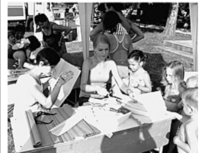
Készülnek a papírvirágok