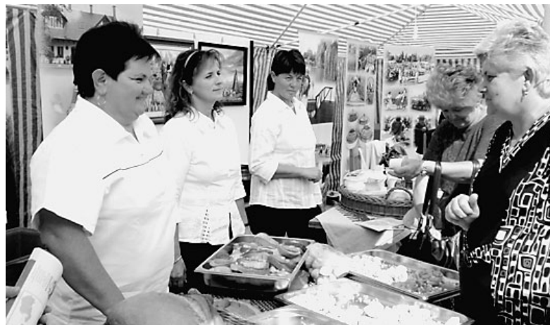
Nem vallottunk szegényt Hajdúszoboszlón