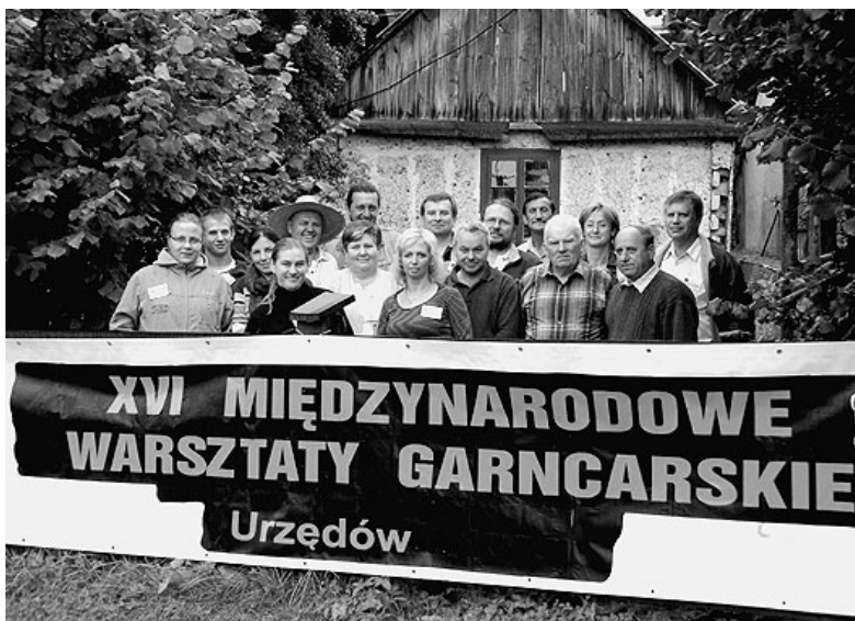
Lengyel és magyar fazekasok