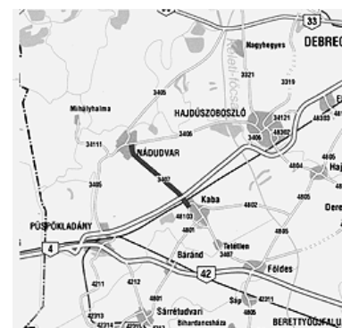
A felújítási projektben érintett útszakasz

További információ: Magyar Közút Nonprofit Zrt. Kommunikációs Igazgatósága; Tel.: 06-1-819-9144. E-mail: kommunikacio(g)kozut.hu Weboldal: www.kozut.hu