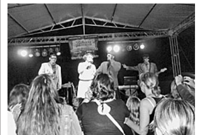
A színpadon az Irigy Hónaljmirigy