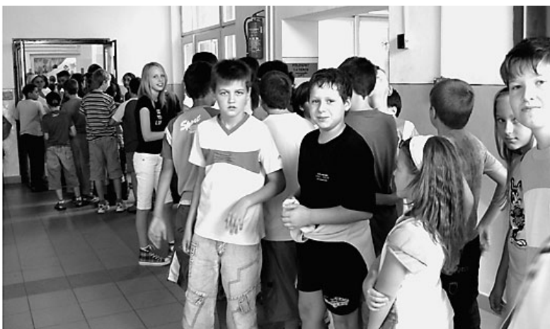
Továbbra is probléma az ebédlő zsúfoltsága. 580 tanuló ebédel az iskolában. Az ebédlőbe jutás gyakran hosszas sorban állás árán sikerül csak

Úgy mentél el tőlünk, mint ősznek virága, Sírba szállt veled szívünk boldogsága, Segítő szavad soha nem feledjük, Dolgos két kezéd örökké érezzük. Nélküled az élet üres és sivár, Hiába díszíti sírodat virág, Könnyes szemmel már csak a virágokat nézzük, Fájó szívvel már csak rád emlékezünk.