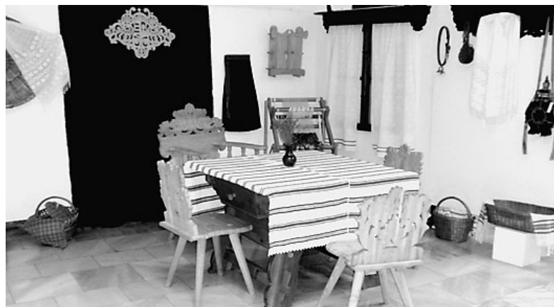
Az alkotó tanulók számára gyakran nyílik megmutatózási lehetőség