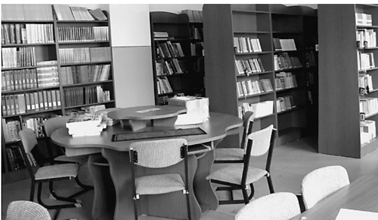
A könyvtár új arculata. Új bútorzattal és 1 000 000 Ft értékű könyvvel gazdagodva várja az olvasni vágyó kicsiket és nagyokat