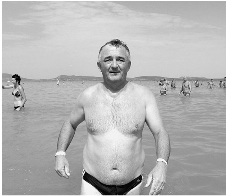
Gyaloglás a tóból a déli partra

– Színtet teljesíteni nem kell, feltétele nincs, persze az úszni tudás elengedhetetlen. Jelentkezési lap kitöltése, nevezési díj befizetése után általános orvosi vizsgálaton kell átesni. Itt jobban megszűrjük az elsőként úszókat. Majd minden induló csuklójára vonalkóddal ellátott karszalagot helyeznek fel. Ezt a