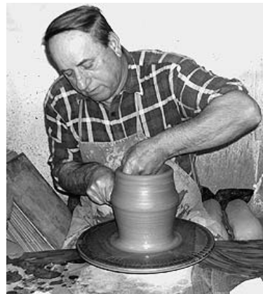
Ezrével kerülnek ki műhelyéből a szebbnél szebb darabok

– Szakmunkásképzőt végeztem, de jártam gimnáziumba is, Hajdúszoboszlóra. Később pedig megszereztem a szakoktatói képesítést, s a nádudvari szakiskola megalakulása, 1992 óta oktattam a fiatalokat a fazekas mesterség tudnivalóira – idézi fel útját a 61 éves István, aki szenvedélyes gyűjtő is. Örömmel mutatja több tájházat megtöltő tárgyait, a rengeteg cserepet, a pásztorélet kellékeit, a földművelő és