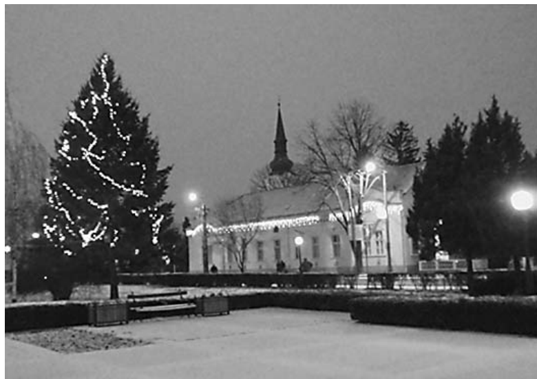
Mint a legtöbb településen, városunkban is ünnepi fények díszítik a központot

minden kedves lakosának boldog karácsonyi ünnepeket kíván az Önkormányzat és a Nádudvari Hírek szerkesztősége!