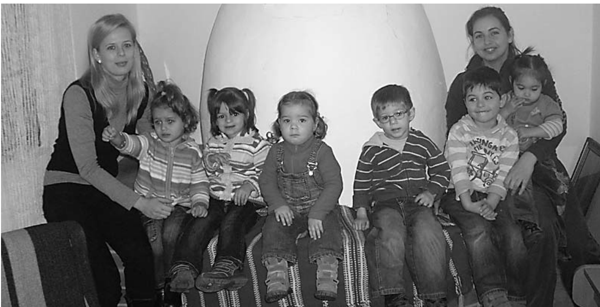
Angyalkertes csemetéikkel nemrég Báránra kirándultunk a Mayer tanyára, ahol nem csak finom parázson sült kenyérlángost ettünk, hanem az adventi készülődés jegyében kézműveskedtünk, sokat énekeltünk, táncoltunk, megismertük a tanya állatainak apraja-nagyját, majd a kemencénél melegedtünk ismét föl