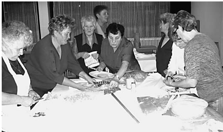
A hagyományápolás új színterét teremtette meg az Őszirózsa Nyugdíjasklub és a Mozgáskorlátozottak Egyesülete november 27-én: felelevenítették a csigacsinálás nádudvari hagyományait, ahol vendégül látták a tetélteni csigacsináló kör tagjait is. A jó hangulatról a Kéknefejejs citerazenekar gondoskodott, így a csigavég taposása sem maradt el

December 31-én (pénteken) Batus Szilveszter. Búcsúztassa az óvet kulturált környezetben élőzenével! Jegyár: 1000 Ft/fő, 10 fő fölötti társaság 800 Ft/fő, 14 éves korig 400 Ft/fő.