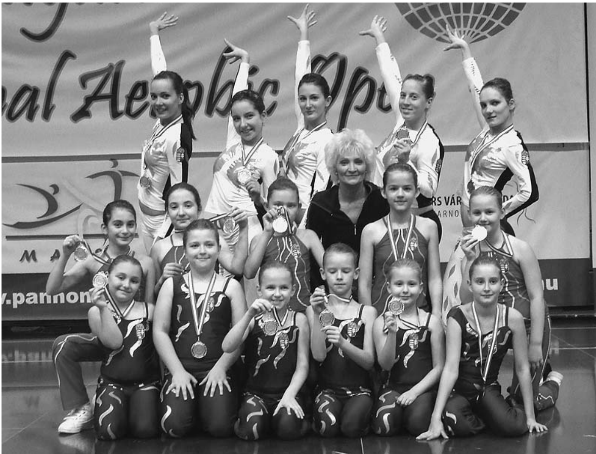
Az egyesület gyermek- és ifjú sportolói egyre nagyobb megbecsülésnek örvendenek városunkban

A verseny érdekessége volt, hogy a nap folyamán híres fitnessguruk tartottak órákat a gyerekeknek. Így találkozhattak többek között Katus Attilával, Schobert Norbival és Rubint Rékával. A nap végén egy kis gálaműsorral zárták az évet. Mindenki számára élményekkel teli nap volt.