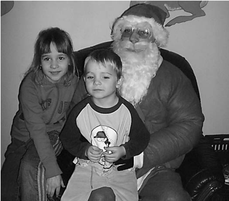
Közös fotó a Mikulással