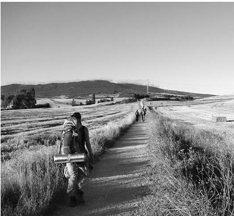
Egy hónapon kell gyalogolni az Úton