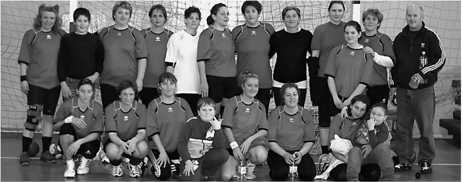
Az Akarat SK hölgykoszorúja a Krampusz-kupán

Krampusz-kupa néven rendkívül jó hangulatú kézilabda villámtornát rendezett az Akarat SK női kézilabda csapata december 5-én, amelyen három gárda mérte össze a tudását.