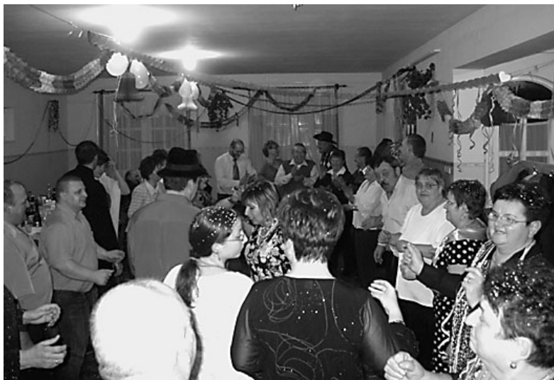
Óvbúcsúztató a Csorvási-házban