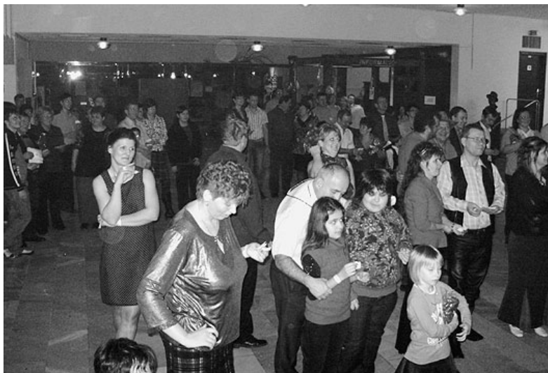
Várakozás az új esztendőre