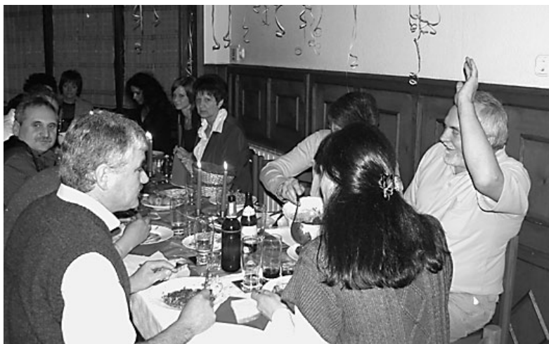
A Kisvárosi Panzió vendégei