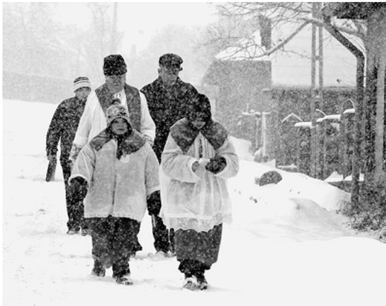
Házszentelő „menet” Székelyföldön – felvételünk illusztráció

Régebben otthon a szenteltvízzel megittatták az állatokat, hogy ne legyenek az év folyamán betegek, vagy az emberek magukra locsolták, betegségek vagy rontás ellen. Egyes helyeken a ház földjét is meglocsolták, hogy áldás legyen a házon.