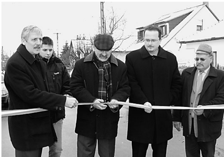
A szalagátvágás pillanata; az ERFA adta mind a 280 millió forintot

A három tájegység határán fekvő Nádudvar jellegzetessége, hogy miköz-