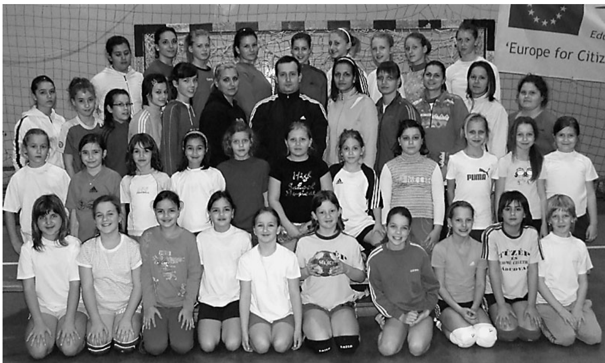
Női kézilabdacsapatunk nagy családját a legkisebbektől a felnőttekig

Minden csapat életében akadnak hullámvölgyek és hullámhegyek. Városunk női kézilabdacsapata 2007 nyarán - amikor is az addigi edző, szakosztályvezető és minden Győrvári Viktor távozott az együttes éléről - az előbbibe, mély hullámvölgybe került. Óriási volt a bizonytalanság a jövőt illetően a játékosok körében, így aztán többen távoztak is az addig stabil NB II-es csapattól. Volt, aki Mátészalka, volt, aki Derecske, s volt, aki Debrecen felé vette az irányt. Vészesen telt az idő, közeledett az új bajnoki idény, és nem hogy csapat, de még edző sem akadt, aki vállalta volna a folytatást. Aztán az utolsó utáni pillanatban, néhány nappal a szezonkezdet előtt csapatunk fuzionált a D. Medikus megyei bajnokságban szereplő gárdájával, amelynek a tréneré Jürgen Böcking volt. Úgy tűnt, mindkét fél hasznot húzhat a fúzióból, hiszen a debreceniek magasabb osztályba léphetek, miközben egy fél csapatra való játékos, no meg edzőt is hoztak hozományként. Így kezdődött el a 2007-2008-as évad, amely inkább kudarcokról, mintsem sikerekről szólt. A csapat végül kiesőként, seregajtóként, mindössze 5 ponttal a tarsolyában zárta a bajnokságot, miközben az utánpótlás-képzés tulajdonképpen megszűnt. Szerencse volt a szerencsétlenségben, hogy olyan kevés csapat nevezett a soron következő új NB II-es bajnokságba, hogy együttesünk kiesőként is megtarthatta az indulási jogát. De már nem a debreceni „idegenlégiósokkal”.