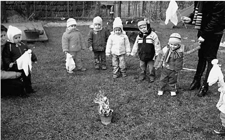
Gyönyörködtek a kislebaba-lángban

Webalbumunk: www.picasaweb.google.com/angyalkert.nadudvar