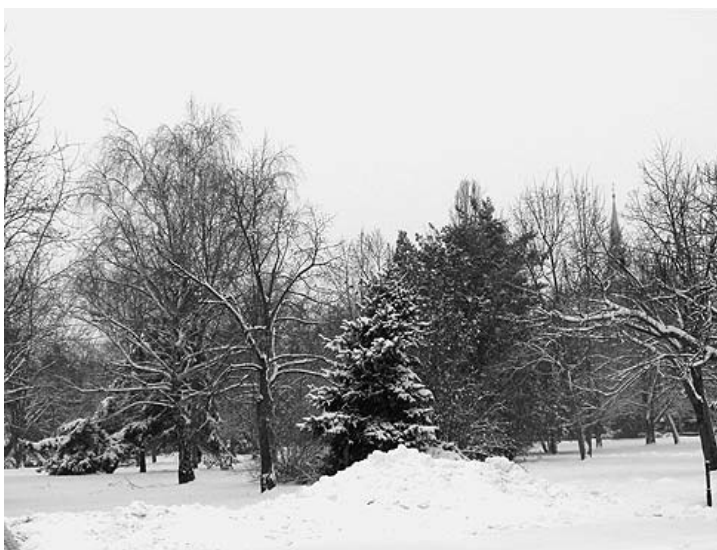
A természet is örülne már a kikeletnek

A hóvirágok már kidugták a fejüket, és joggal reménykedtünk a tavasz közeledtében. De február 24-én másfélnapos sűrű hóesés ébresztett, s ez „kijózanított” bennünket, jelezvén: még várhatunk a kikeletre