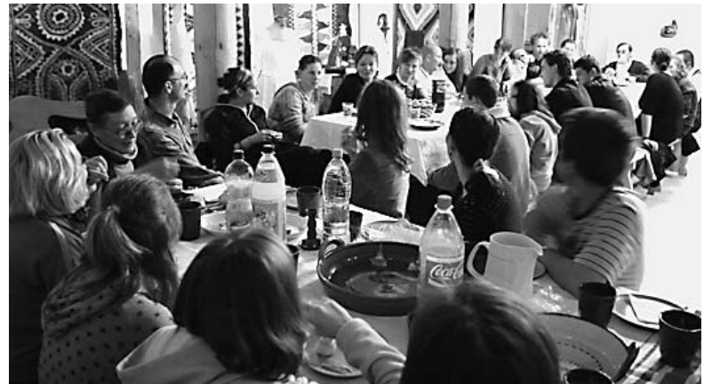
A szülők elmondták, mit várnak az oktatástól