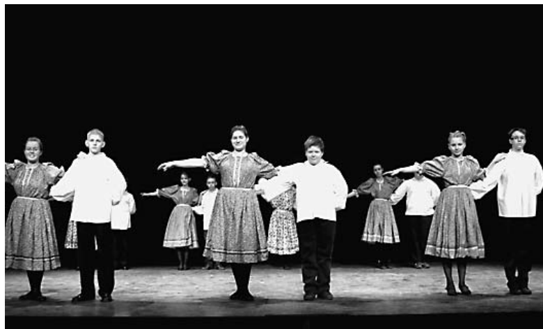
Lázás készülődés az ünnepre