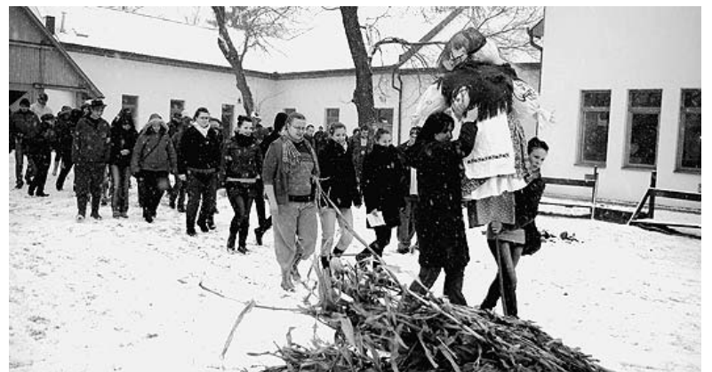
Na, fránya tél, neked már véged!