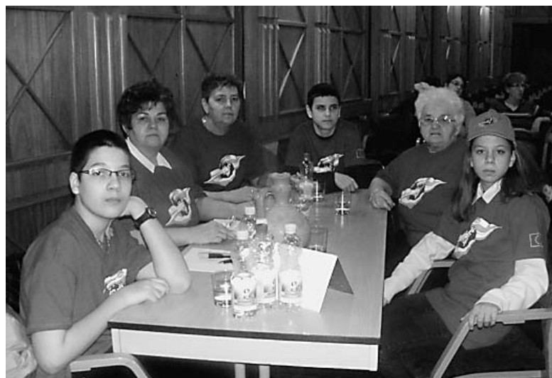
A „legökösabbak” között a nádudvariak