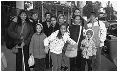
A vidámpark előtt

A mozgáskorlátozottak budapesti egyesülete tizenharmadik éve szervez nagyszabású vidámparki délutánt fogyatékossgal élő gyerekeknek, fiataloknak és szüleiknek. Október 18-án több mint háromezren látogattak el az