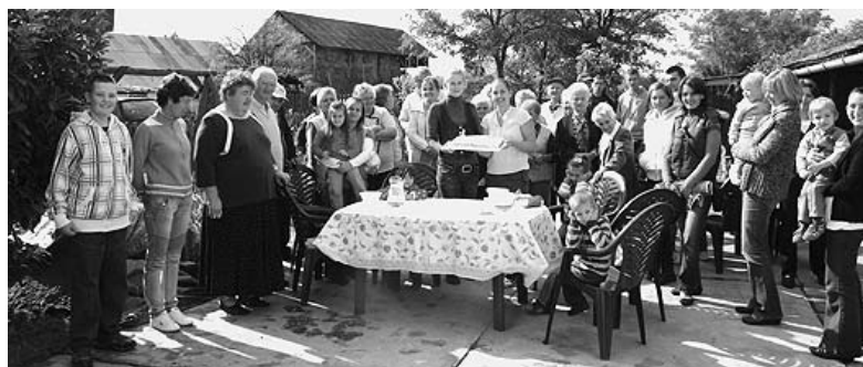
Boldogan ünnepelték a születésnapot

Az intézménnyel kiváló kapcsolatban ápoló Szociális Szolgáltató Központ Idősek Klubjának tagjai meséskönyvekkel is meglepték a kis lurkókat, amellyel, hogy a finom ebédet is nekik köszönheték a vendégek.