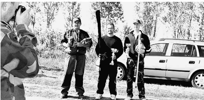
Lencsevéken a dobogósok