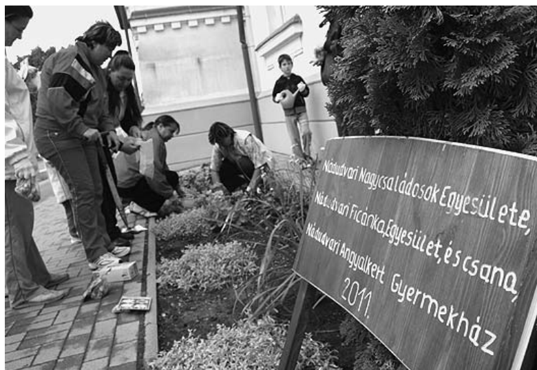
A virágos kert és gondozói

A Tolbuhin utcai iskola Fő utcára néző ablakai alatt szorgos kezek ültettek virágokat október 8-án délután. Három helyi szervezet vette kiemelt gondozásba a néhány négyzetméternyi közterületi virágoskertet. Az Angyalkert Gyermekház és Családi napközi ötletéhez csatlakozott a Nádudvari Ficánka Kiemelkedően Közhasznú Egyesület és a „Mindent a családért” Nádudvari Nagycsaládok Egyesülete, hogy a Nádudvari Településfejlesztési és Városgazdálkodási Kft. „fennhatósága” alá tartozó területet örökbe fogadják, az önkéntesség évében és jégében.