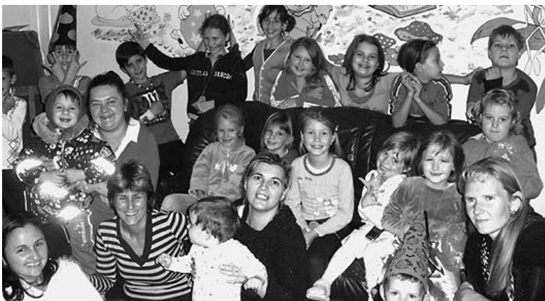
A Halloween-parti résztvevői jól érezték magukat