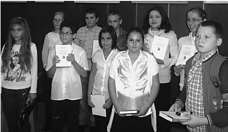
A díjazott versmondók

Vers- és prózamondó versenyt rendezett az Ady Endre Általános Művelődési Központ és Városi Könyvtár, az 1956-os forradalom 55. évfordulója