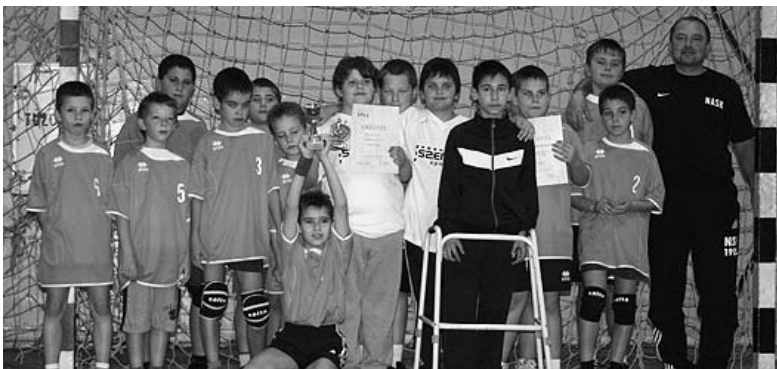
Az ezüstérmes U10-es nádudvari csapat november 17-én