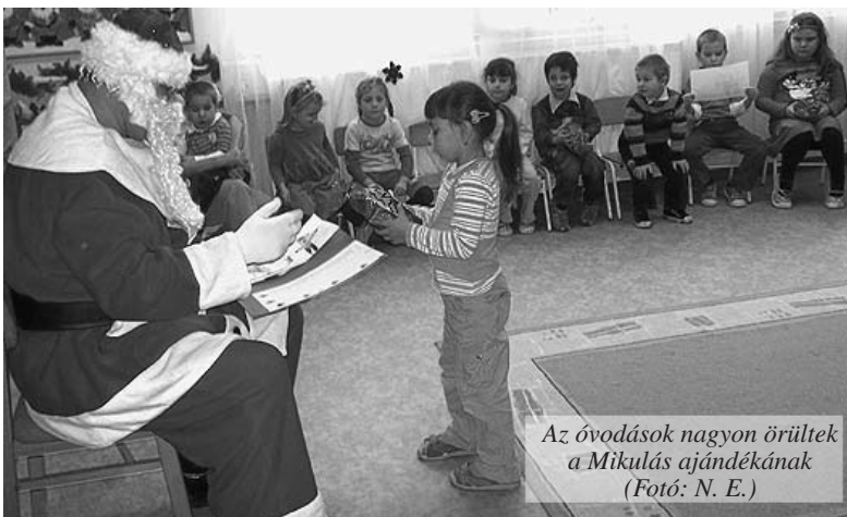
Az óvodások nagyon örültek a Mikulás ajándékának

mára ott lapult az ajándékcsomag. Mivel ma minden gyermek jól viselkedett, ezért Mikulás megígérte, hogy este még egyszer ellátogat a mindenkihez, csak a tiszta cipőjüket tegyék ki az ablakba!