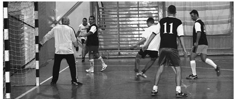
Szögletre várva Retró FC–Zrínyi FC mérkőzésen

December 1-jén újtára indult a labda a sportsarnokban: megkezdődtek a 2012-2013-as teremlabdarúgó bajnokság küzdelmei. 13 csapat nevezett a megmérettetésre, amely így közel kétszáz főnek biztosít sportolási lehetőséget hétről hétre.