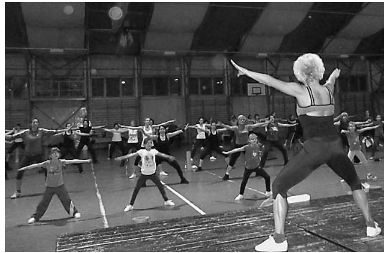
Az első ingyenes foglalkozás sikeres volt