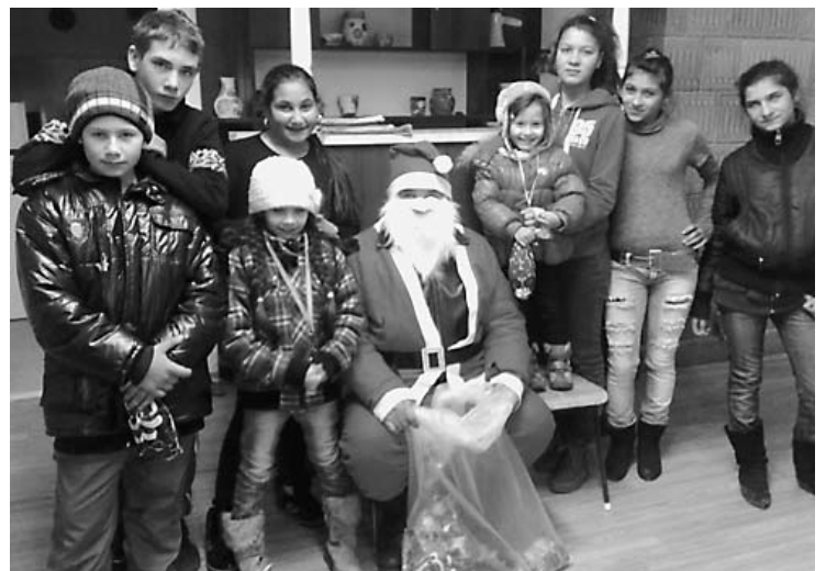
A Nádudvari Roma Nemzetiségi Önkormányzat és a Magyarországi Összefogás Roma Rom Szervezet az utóbbi által működtetett Gólya Roma Tanodában közös Mikulás ünnepség keretében ajándékozta meg a tanoda diákjait és több halmozottan hátrányos helyzetű kisgyermeket december 6-án