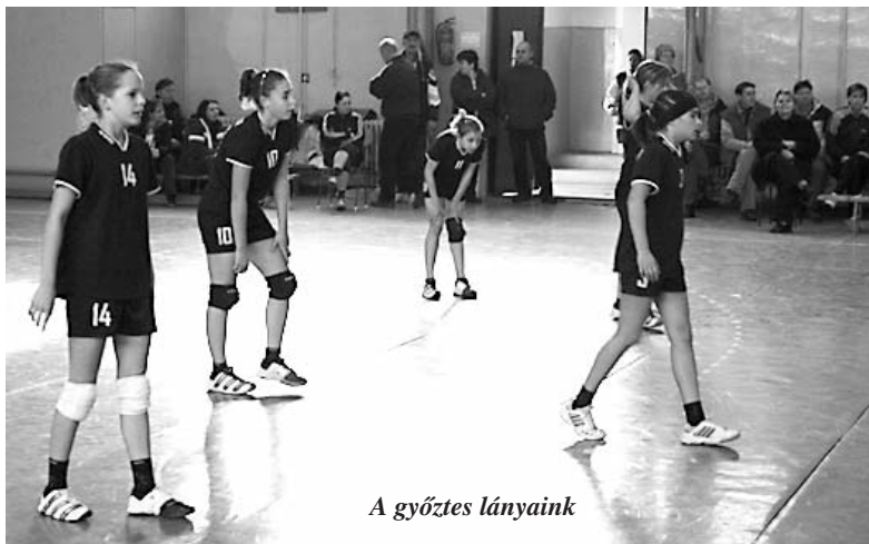
A győztes lányaink

Az U16-os korosztályú fiúk február 1-jén, Békés városában játszottak Békéscsabával és Orosházával. Mindkét mérkőzésen vesztesen hagyták el a mieink a pályát, de a játékok most is biztató volt.