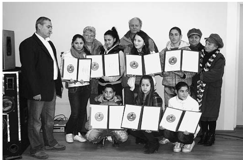
Az ösztöndíjasok tanáraikkal és a projekt megvalósítóival