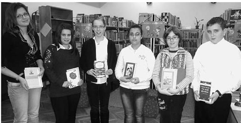
A Kazinczy-verseny legjobbjai