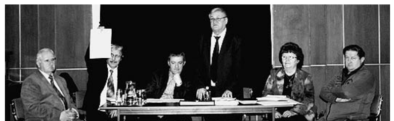
A polgármester a nyertes pályázati dokumentumot mutatja

A harmadik napirendi pontként a szennyvízberuházás III. ütemének forrásösszetételét vitatták meg. A teljes költség 2,026 milliárd forint, amelyben mintegy 104 millió Ft