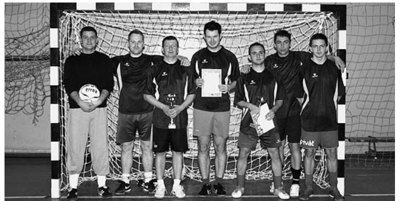
A bajnokság csapat a kupával.